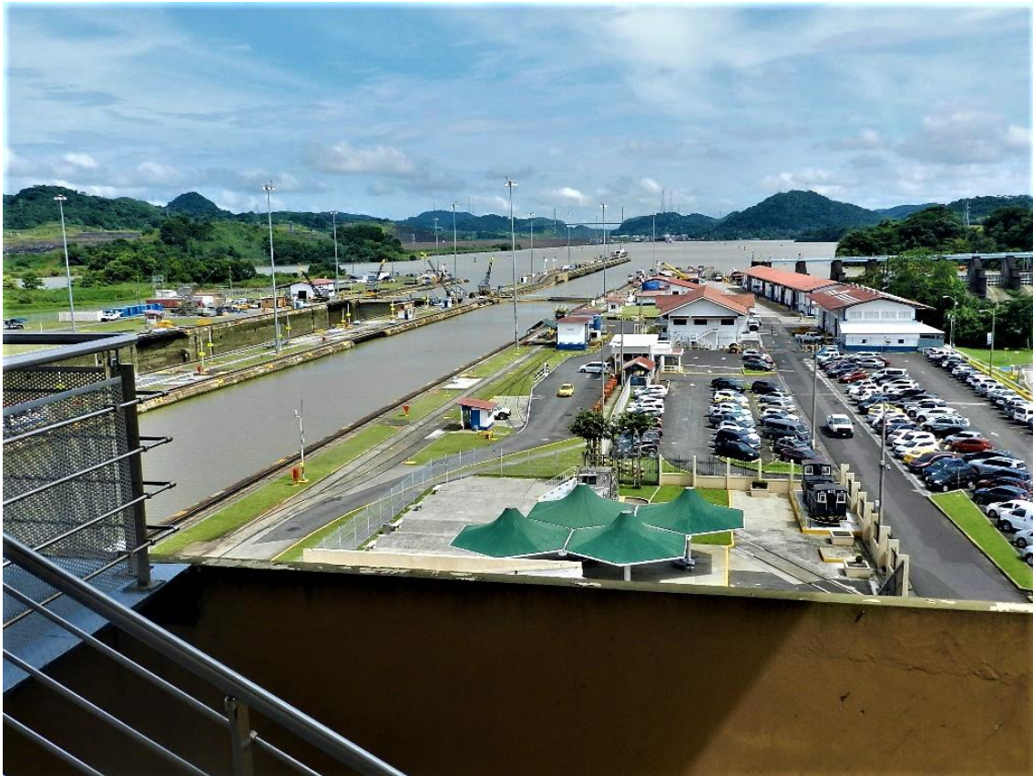
L'entrée du canal de panama à Miraflores

d'autres personnes venues de partout... J'ai enregistré de nombreuses photos. Les informations sont fournies et inscrites en espagnol et en anglais, rien en français. On y trouve cependant des photos et des messages concernant les Ingénieurs et Entrepreneurs français Ferdinand de LESSEPS (1805-1894) et Philippe BUNAU VARILLA (1859-1940) qui ont initié des travaux et donc participé à la réalisation du canal. A la lecture du texte concernant de LESSEPS je n'ai trouvé qu'un petit détail en français. J'ai aussi remarqué des photos des héros dont des travailleurs de la Caraïbe Orientale, disons de chez nous... (documents et photos à l'appui pour illustrer cette visite). Dans l'après-midi nous avons été accueillis par un très grand centre commercial de « BIENBENIDOS A METROMALL PANAMA » à San Miguelito et par un dinosaure à l'entrée ; à l'arrière se trouvent de grandes girafes en plastique. Les trains passent en faisant une halte dans les environs et le va-et-vient entre la ville de Panama et cette banlieue.