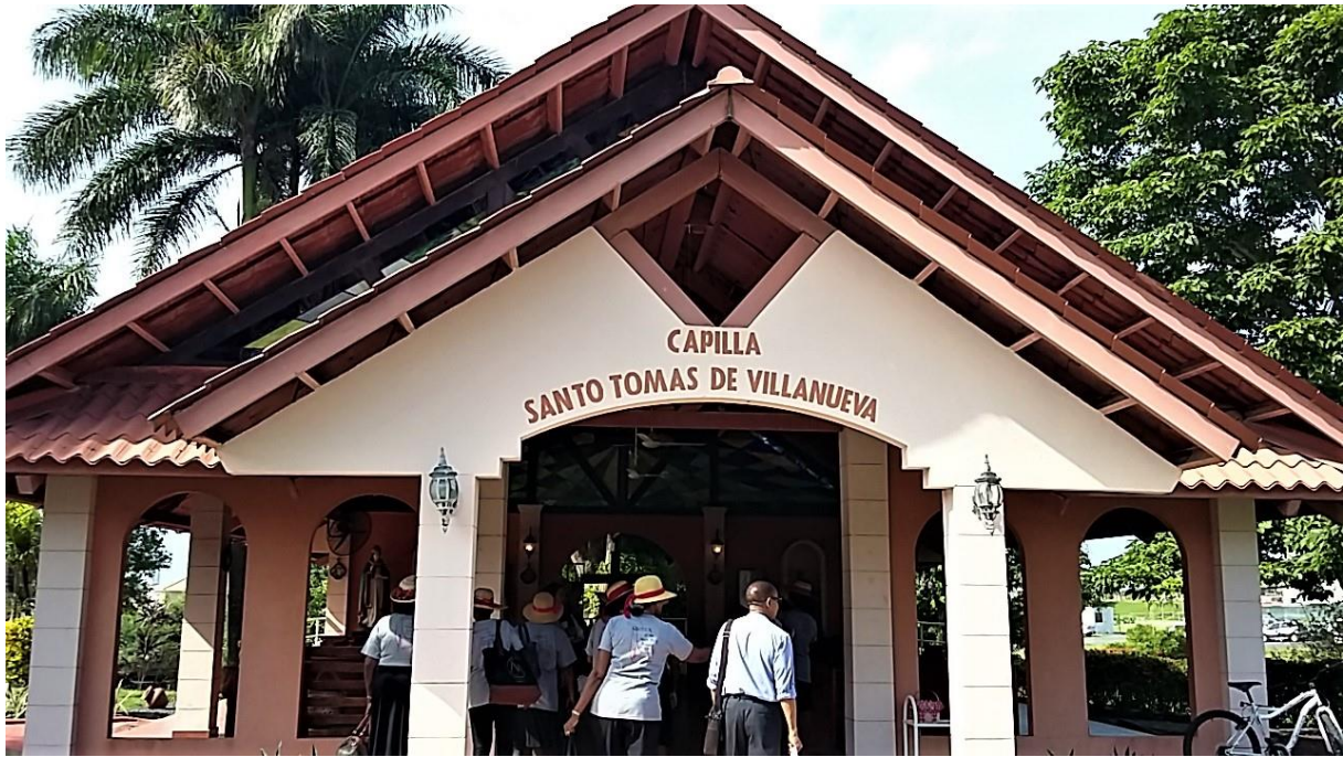
La chapelle Sto Tomas de Villanueva

Les églises sont nombreuses, surtout catholiques, dans la capitale ; nous nous sommes rendus dans plus d'une vingtaine constituée de paroisses, de cathédrales, de chapelles, etc.