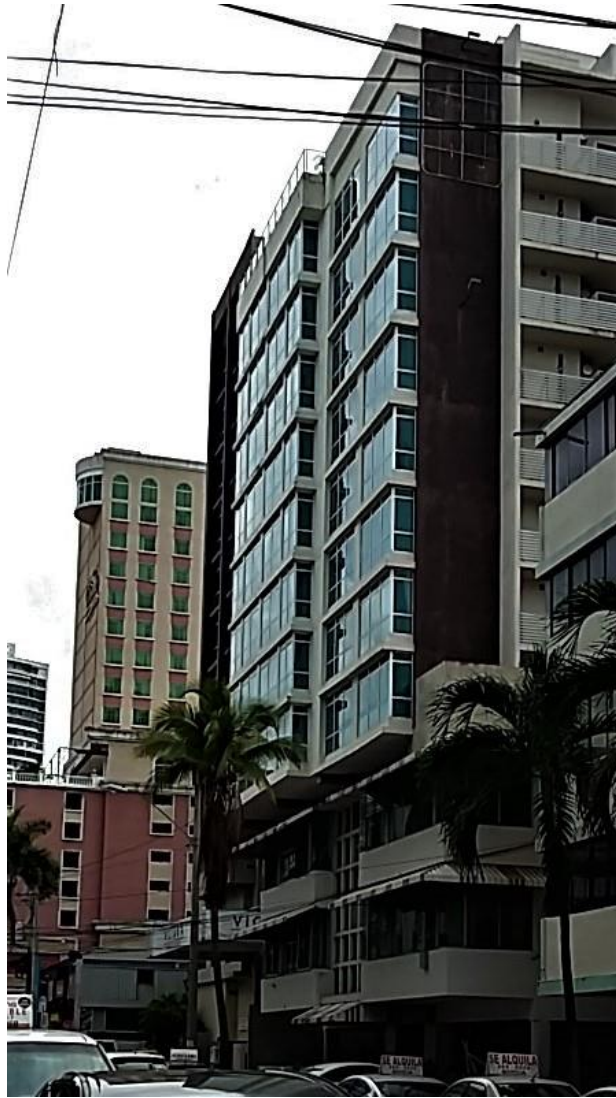
VICTORIA Hotel & Suites, debout en bleu pâle au centre

Nous avons quand même été avertis quant aux précautions et à la conduite à avoir ici, parce que, comme partout ailleurs, il y a des gens corrects et des délinquants. Finalement personne ne s'est plaint d'avoir été bousculé ou dérangé.