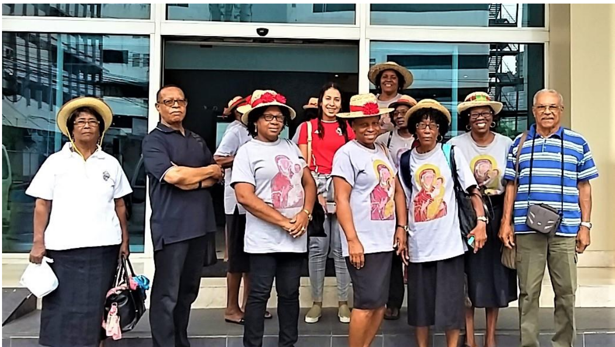
Les 16 de la Légion de Marie de Ste-Lucie, y compris nous de la Martinique

L'actuel Président, depuis le début du mois de juillet, de la République Démocratique de PANAMA s'appelle Laurentino CORTIZO. J'ai juste aperçu la Maison Blanche où il habite, surveillée par des militaires quand même sympathiques et qui m'ont laissé faire des photos dans les environs en bordure de la mer.